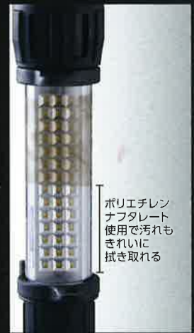
ポリエチレン ナフタレート 使用で汚れも きれいに 拭き取れる